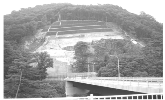
着々と進む関連工事によって、地滑りの危険が高まっている

西宮市の関連では武庫川ダム計画(3月に一般質問しました)がありました。また、現在検討されている「大阪国際空港(伊丹空港)と関西国際空港との統合問題」による不要な大型公共事業計画が持ち上がらないか、注意深く見ていく必要があると強く感じました。